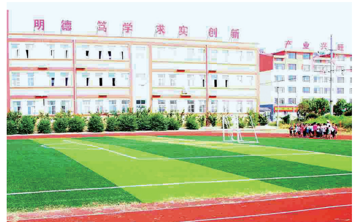
标准化建设种庄小学