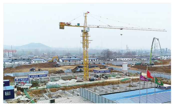
省级重点项目青岛啤酒项目建设现场