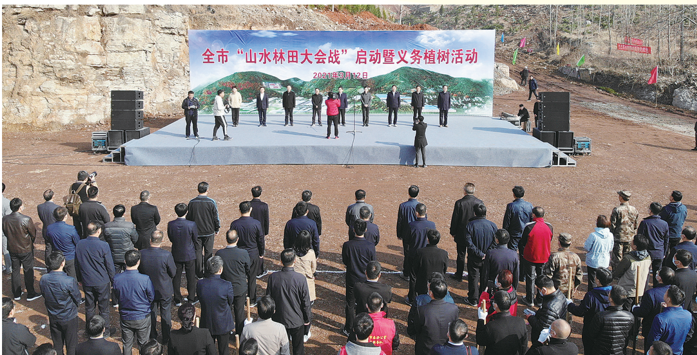
“山水林田大会战”启动仪式

盛夏的陶庄，繁花似锦，生机盎然。在省级重点项目青岛啤酒项目建设现场，机器轰鸣声不断，人流、车流汇聚。而在距该项目不远的年产60万吨新型建材项目现场同样是一片繁忙景象，两者一西一东，快速推进，演绎着该镇项目建设和镇域经济崛起发展的激情与活力，为开创陶庄“枣庄第一镇”复兴新局面写下一笔浓墨重彩。