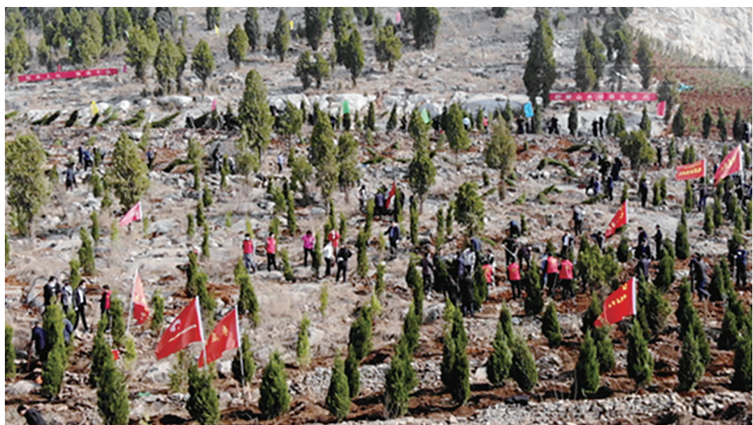
山水林田大会战现场