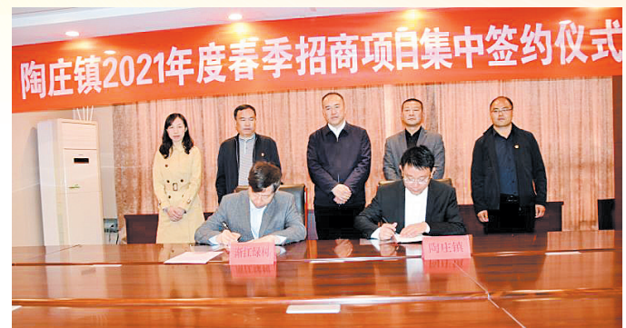
2021年度春季招商项目集中签约仪式

乡村振兴，产业先行。该镇以党支部领办的合作社为引领，充分发挥党员干部模范带头作用，千方百计增加村集体和村民收入。继续推行镇域小型工程内包模式，扩大已成立的村级劳务合作社的承包规模，创建“奚仲劳务合作联社”品牌，不断提升劳务合作社的收益和竞争力；抓实村级集体资源管理“阳光行动”，持续增加村集体和村民收入，确保三年内集体收入20万元以上的村比例达到100%。同时，将党的组织优势转化为乡村振兴的强劲动力，以产业振兴推动乡村振兴，全面加快现代农业和特色高效农业发展，让猕猴桃、草莓、葡萄、火龙果、冬桃等一批特色农产品尽快成长为富民产业和乡村振兴的新引擎。