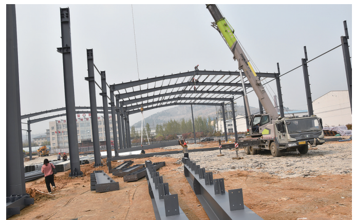
年产60万吨新型建材项目