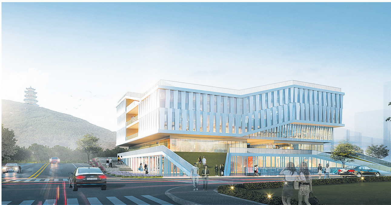
集团自主开发项目晟鸿邻里中心

集团下属山东晟众城市建设综合开发有限公司曾获得“全国工人先锋号”“枣庄市五一劳动奖状”等荣誉称号。开发建设的仲建商务广场、铁道游击队影视城、中国银行薛城支行营业楼等项目先后荣获泰山杯、省优工程、省级绿色环保小区、市榴花杯等荣誉，其中“金水湾”项目是全国首家荣获国际WAN设计大奖、山东省首家270度全景阳台、枣庄市首家荣获国标绿色二星级认证的绿色建筑。