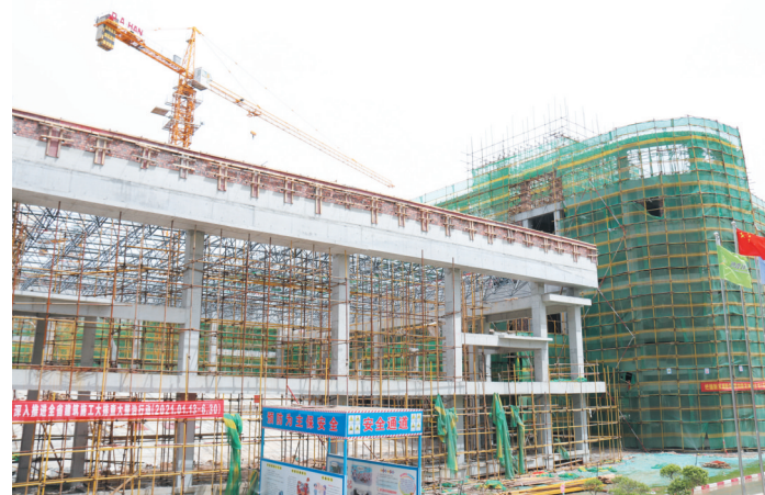
正在建设中的凤鸣中学