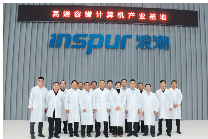
赴浪潮集团等大型国企学习党建工作先进经验

贫困户为载体，巩固提升贫困户脱贫质量，决胜脱贫攻坚战；以选派第一书记进村帮扶为载体，壮大村集体经济、改善帮扶村人居环境面貌。