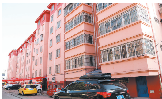
粉刷一新的老旧小区