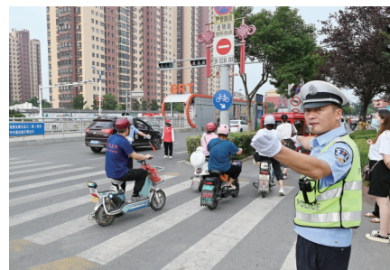
交警与志愿者在路口执勤

倾力规范停车秩序,加强城市主次干道、背街小巷车辆停放管理执法力度,重点整治路沿石以上乱停车、