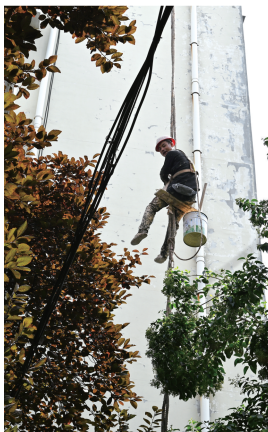
对老旧小区楼面进行粉刷