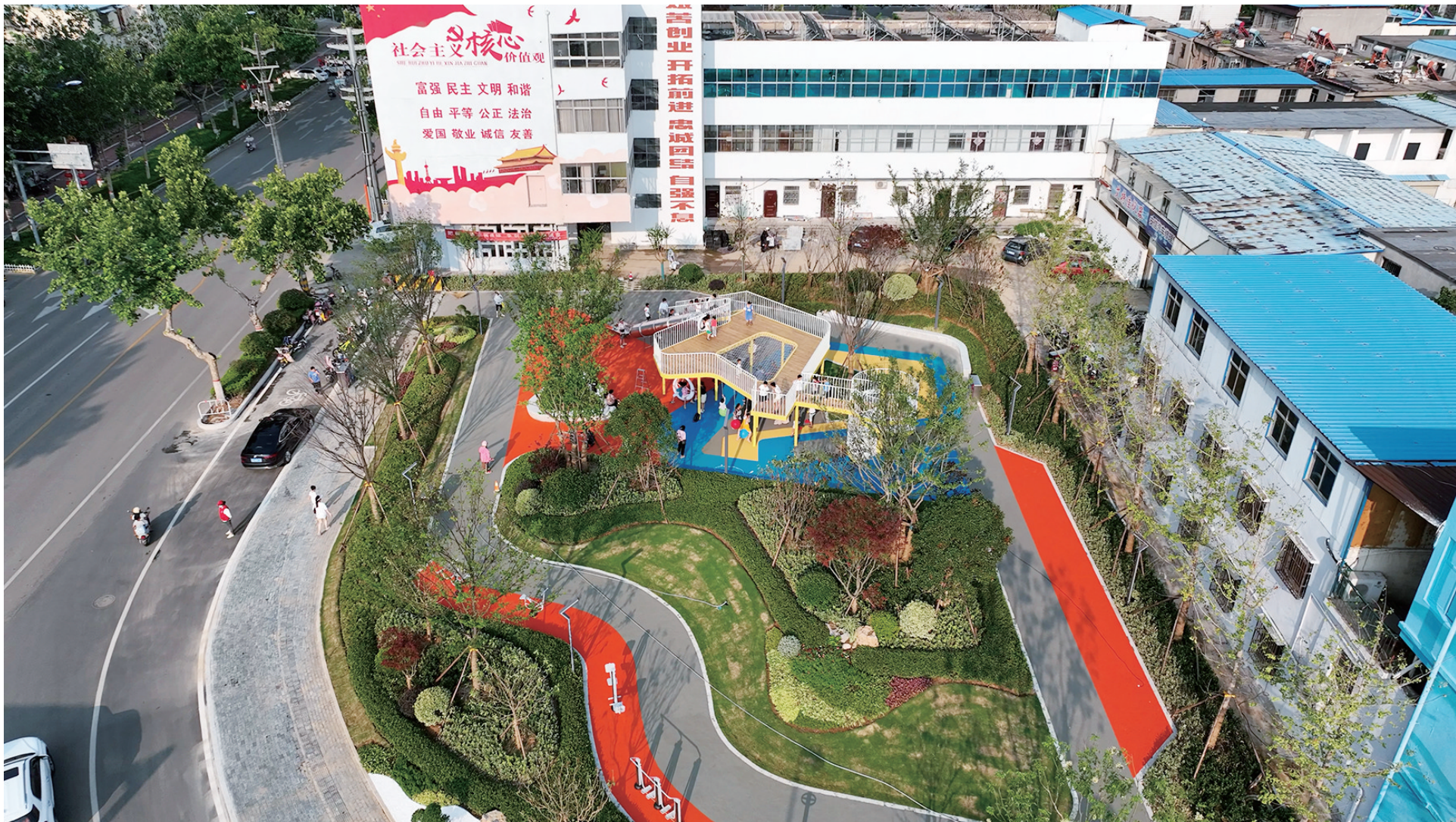
青檀路与君山路交叉口处“口袋公园”

让老城更新,让市中变靓。市中区上下切实增强做好创建工作的责任感和紧迫感,层层传导压力、激发动力,层层统一思想认识,形成“人人动员、人人参与”的良好局面,通过创建全国文明城市让市民“获得感”更强、“幸福感”更浓。