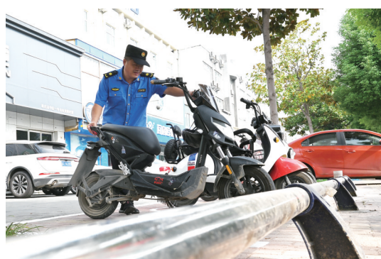
安装停车护栏,整治违规停放车辆