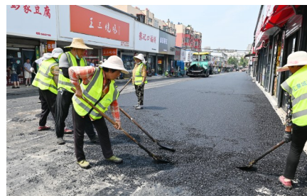
龙头市场进行升级改造

据了解,根据国家对农贸市场测评标准的调整,市中区在重点对龙头、新华、利民3个农贸市场改造提升的同时,将朝阳、建华、幸福等7个便民服务摊点群、新昌、果品、香港街3个批发市场全部纳入改造提升范围,全面拆除违建,统一店铺门头,做好卫生保洁,规范经营秩序。目前,龙头市场内违章建筑已全部