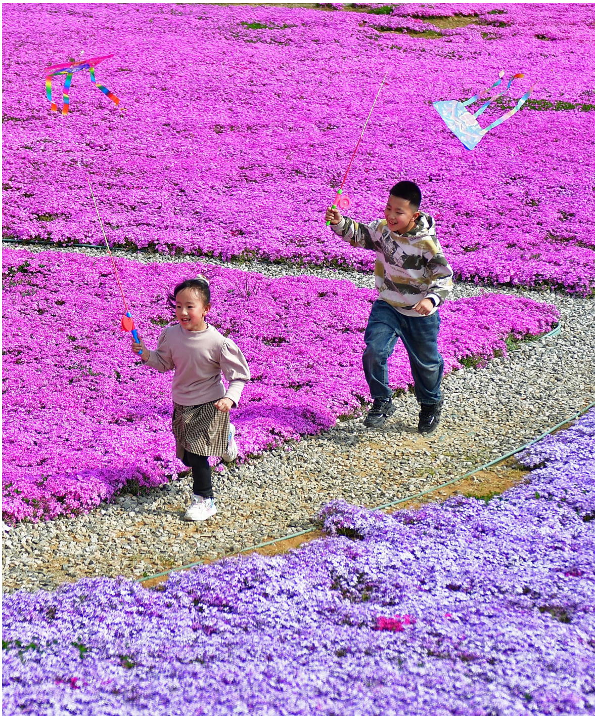
人间四月天，出游享春天。