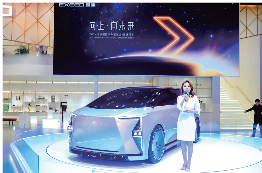
EXEED星途品牌的新车型E08亮相