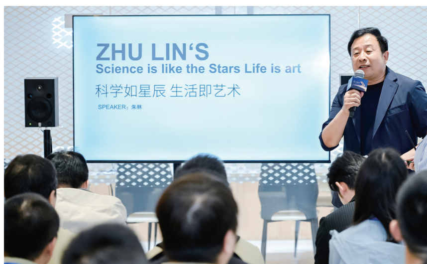
现场讲述科技与美学的碰撞