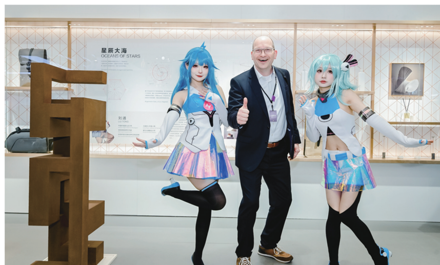
观众与《生长的空间》合影