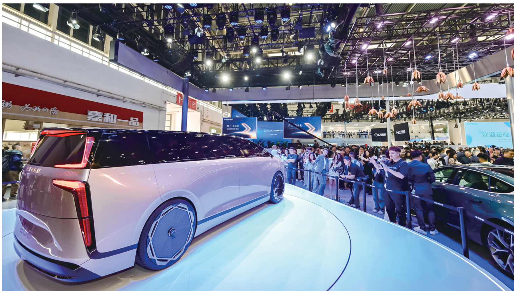
媒体争相采访报道