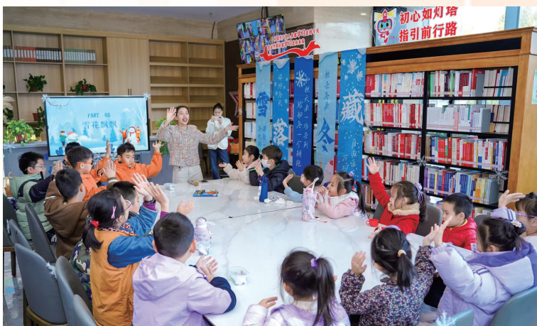
枣庄市图书馆在延时服务的基础上增加“我们的节日”等传统文化活动