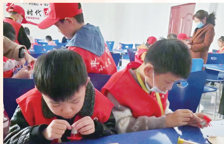
山亭区图书馆错时开放,小达人科普制作让小读者带来无限快乐