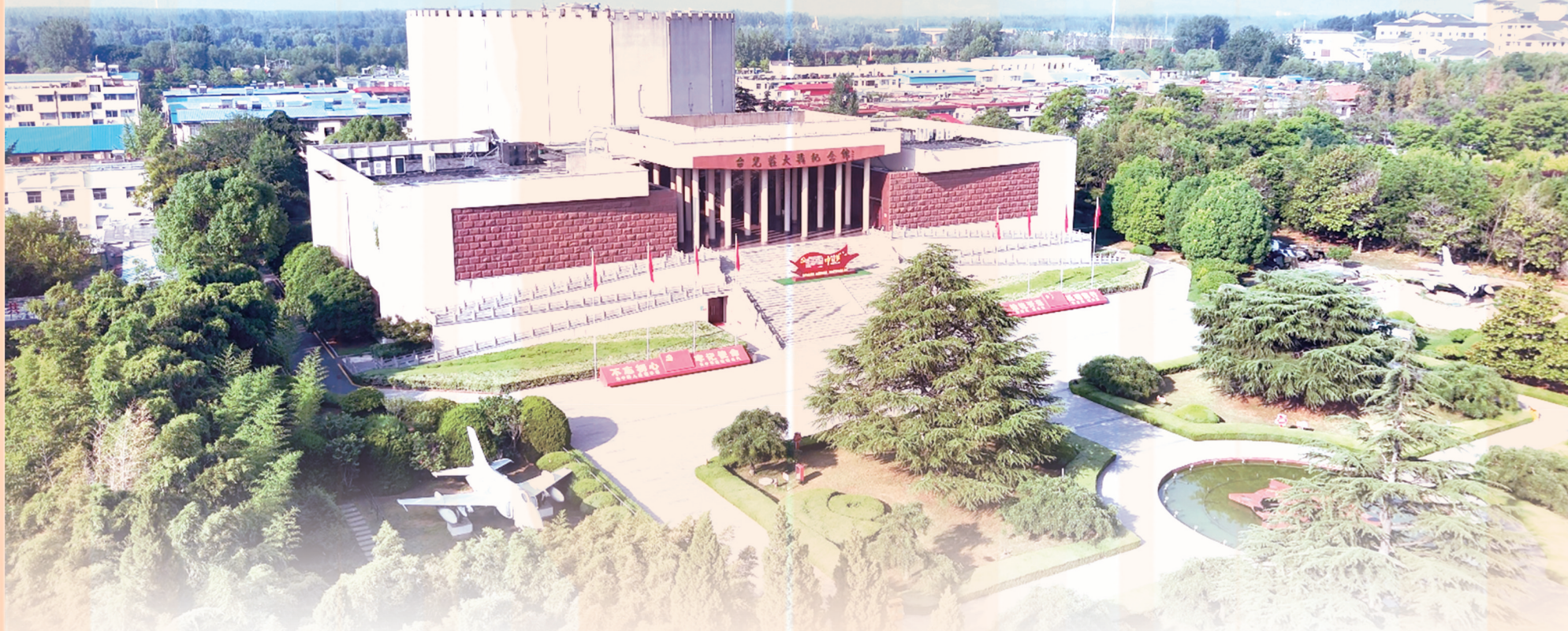
台儿庄大战纪念馆全景

在延时开放期间,台儿庄大战纪念馆在公共文化服务方面积极探索,为传承红色文化、弘扬民族精神拓宽了传播路径,为广大游客提供了更为贴心的服务,同时也创造了更多了解历史、缅怀先烈的契机。观众能够有更充裕的时间进入纪念馆,深入探究台儿庄大战的历史,更好地弘扬伟大抗战精神和民族精神。