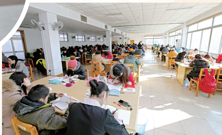
延时服务后,枣庄市图书馆的访客显著增加