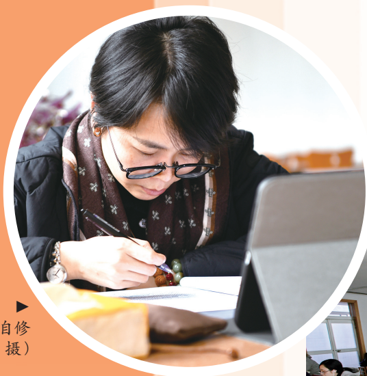
市民在山亭区图书馆自习室学习