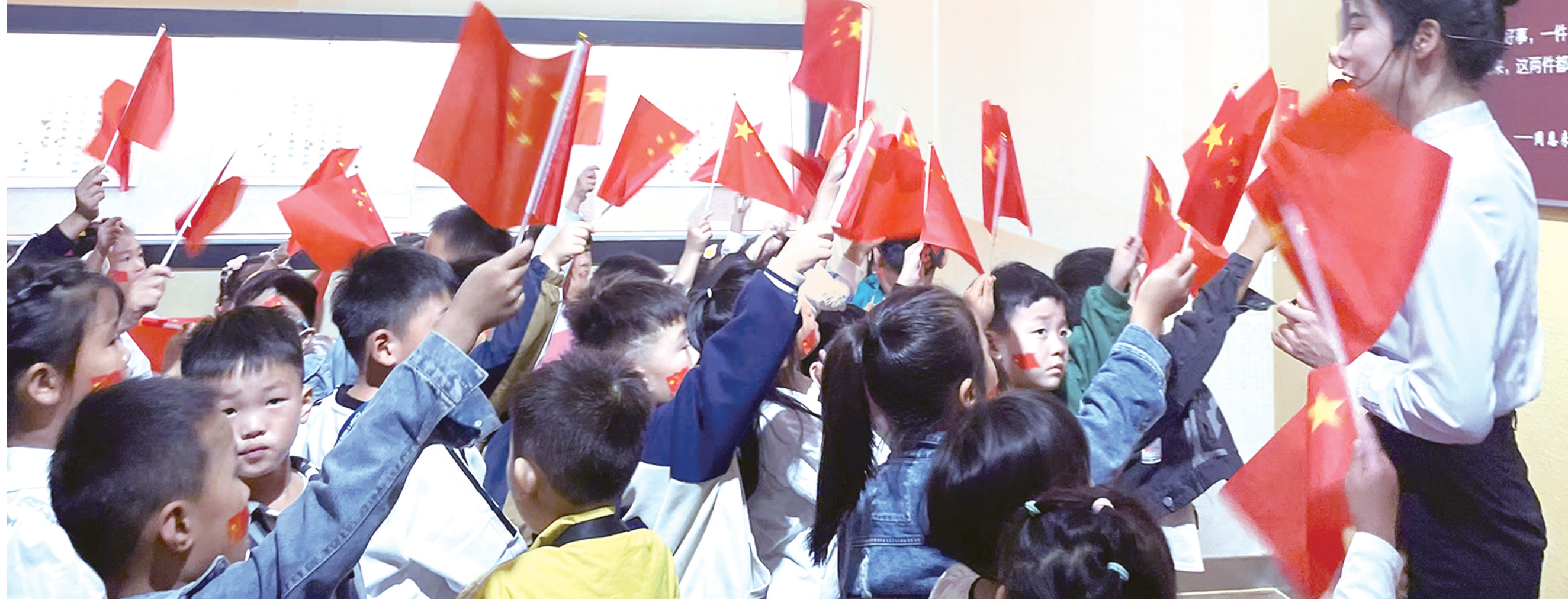
小学生在台儿庄大战纪念馆接受爱国主义教育