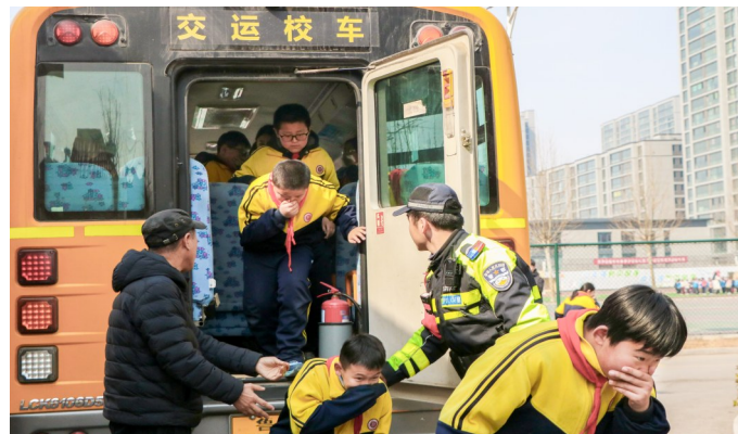
为进一步加强校车安全管理,提高师生安全意识和应急处置能力,3月6日,滕州市公安局交警大队走进北辛实验学校组织开展校车应急逃生演练活动。

(上接第一版)深入查找整改贯彻中央八项规定及其实施细则精神方面存在的短板弱项,扎实推进反腐同查同治,及时将整改成果转化为制度成果,防止问题反弹回潮。要依靠群众开门教育,依托“枣解决·枣满意”诉求回访办理机制等载体,通过实地调研、“公开接访”等方式,广泛征求群众对各级党组织贯彻中央八项规定及其实施细则精神的意见建议,扎实开展“助企惠民作表率、优化营商环境”系列活动,及时解决基层信贷急难愁盼问题,让群众切身感受到学习教育带来的新气象新变化。