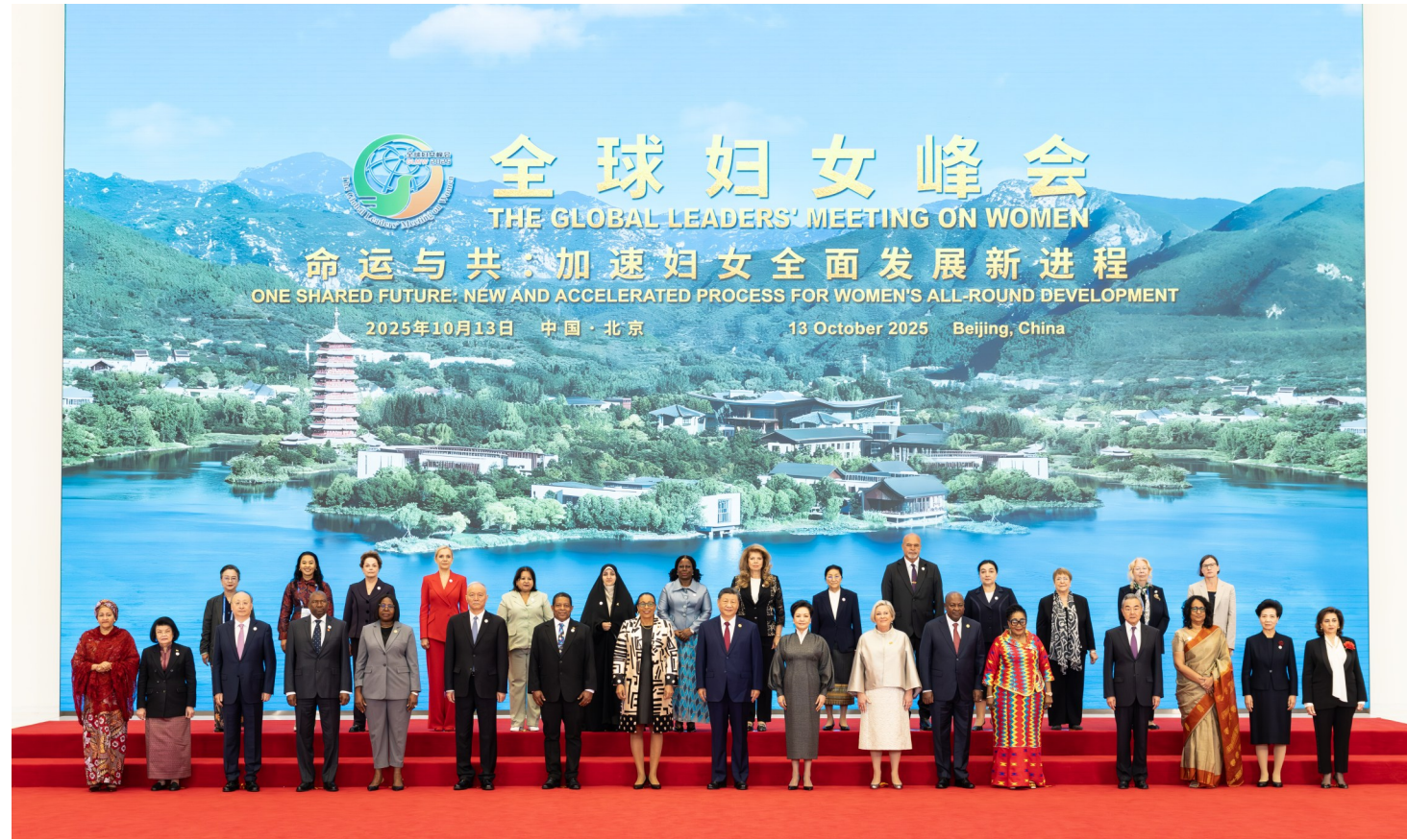
10月13日上午，国家主席习近平在北京国家会议中心出席全球妇女峰会开幕式并发表主旨讲话。