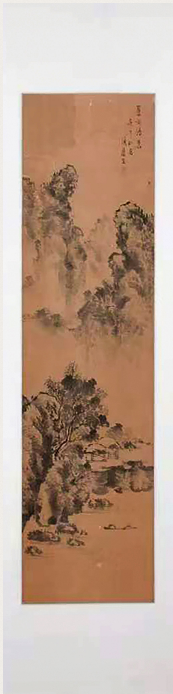
修补后的《山水画》作品