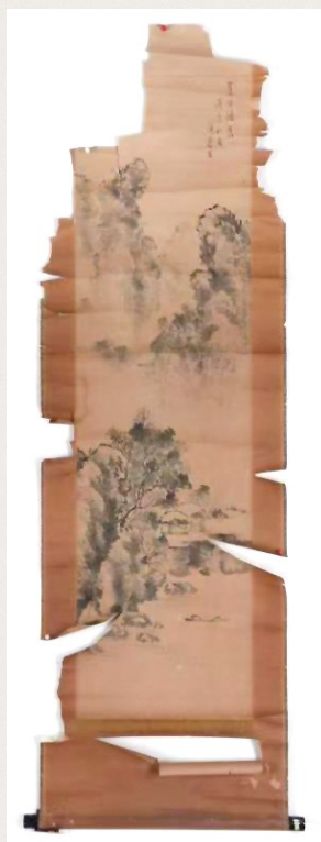
残缺破损老物件《山水画》