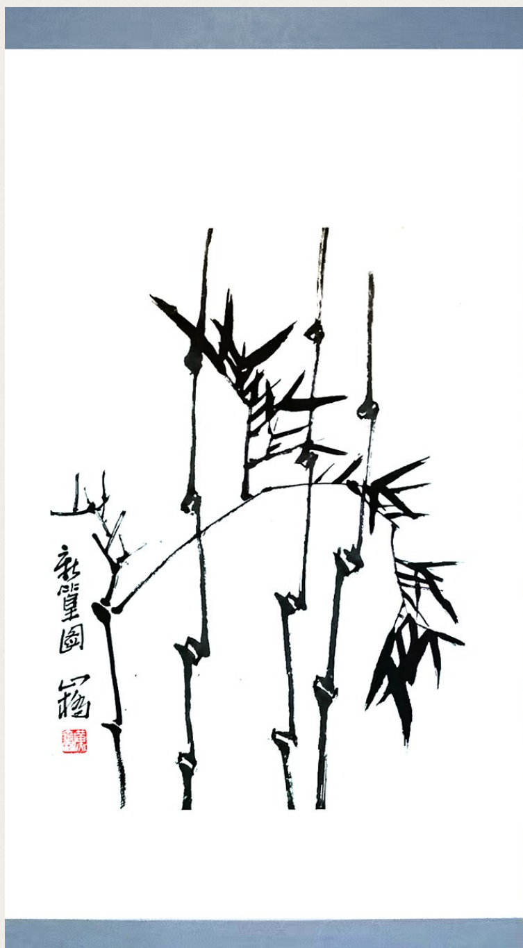
《新篁图》修补后的作品