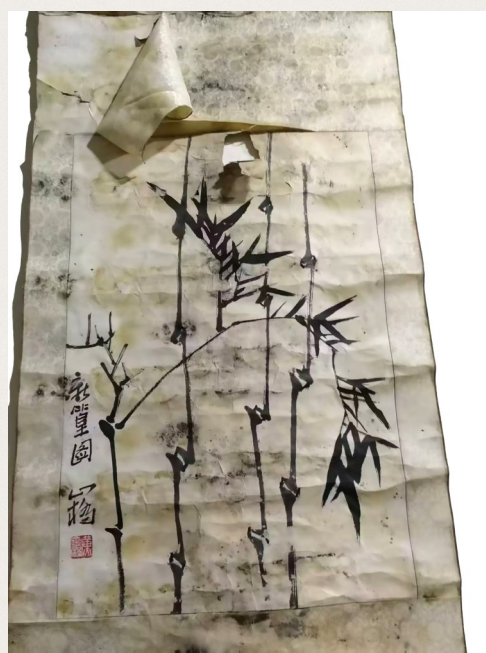
《新篁图》发霉破损原件