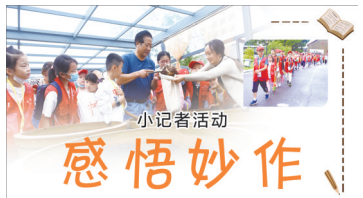
小记者活动 感悟妙作

面塑小老虎的制作过程真是太有趣了!既锻炼了我的耐心、细心,也提高了我动手动脑的能力,老师们都非常辛苦,在以后小记者的学习中我要牢记小记者的口号认真听讲解,多学习多应用,最后合影留念记录这美好的时刻。