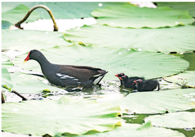
近日,在滕州市龙泉广场的荷塘里,黑水鸡夫妇成功孵化出6只黑水鸡宝宝。