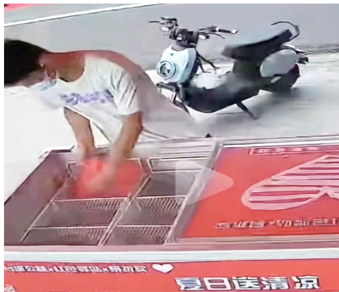
近日,多名热心市民买来矿泉水放到“爱心冰柜”里,网友:小城市里的大温暖。