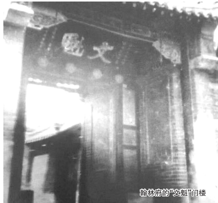
翰林府的“文魁”门楼