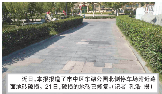
近日,本报报道了市中区东湖公园北侧停车场附近路面地砖破损。21日,破损的地砖已修复。