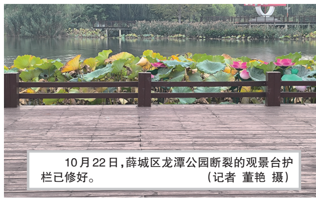
10月22日,薛城区龙潭公园断裂的观景台护栏已修好。