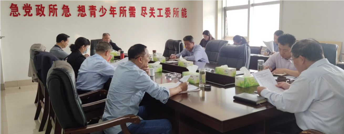
急党政所急 想青少年所需 尽关工委所能